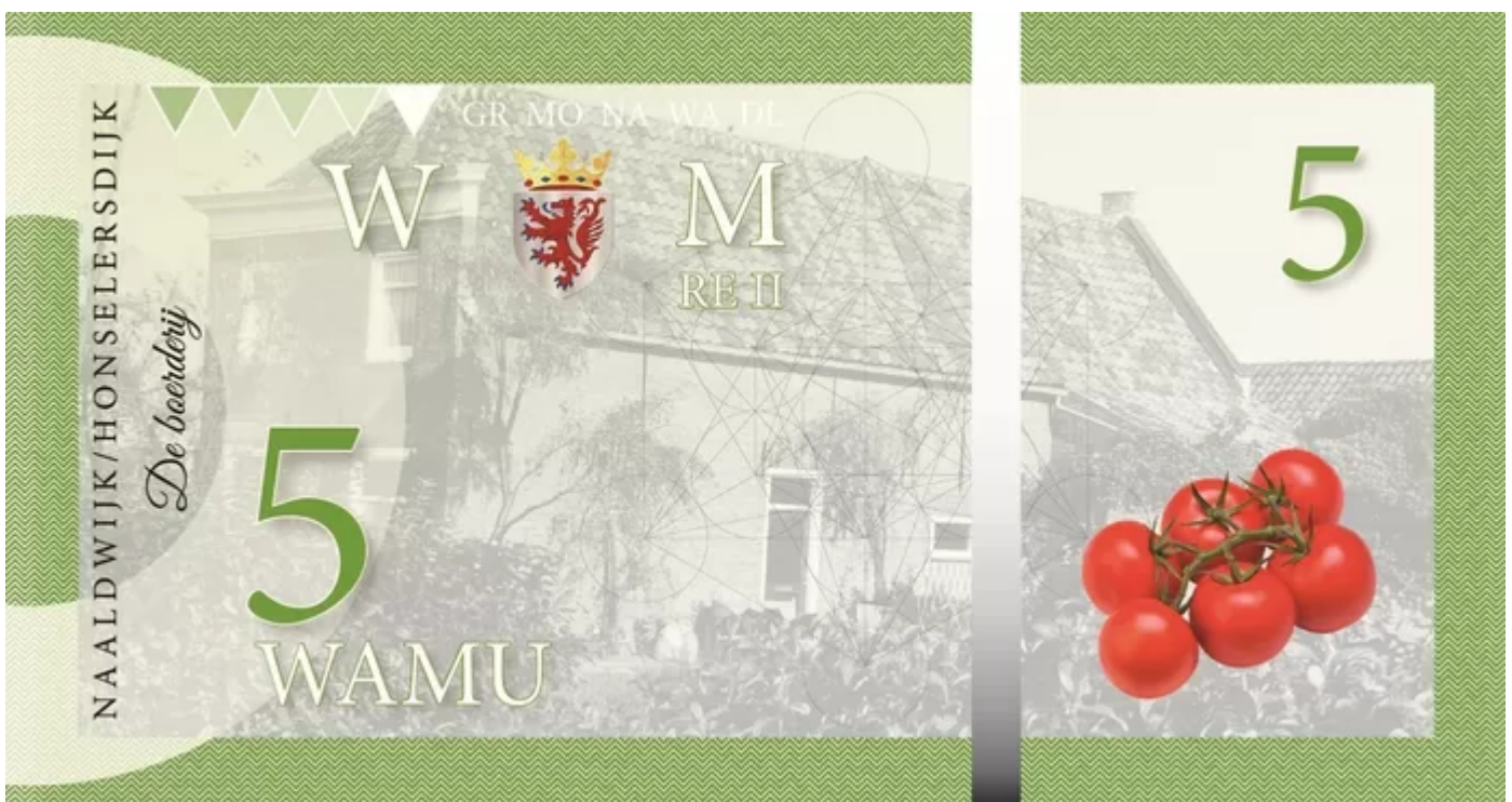
De Watermunt

Tenslotte is er volgens Braun momenteel een soort 'hyperidentificatie' gaande. „Als reactie op het individualisme willen we heel graag bij een groepje horen en kunnen we die identiteit gaan uitvergroten. Extinction Rebellion, de boeren, Amsterdammers, de Westlanders - allemaal doen ze het.”