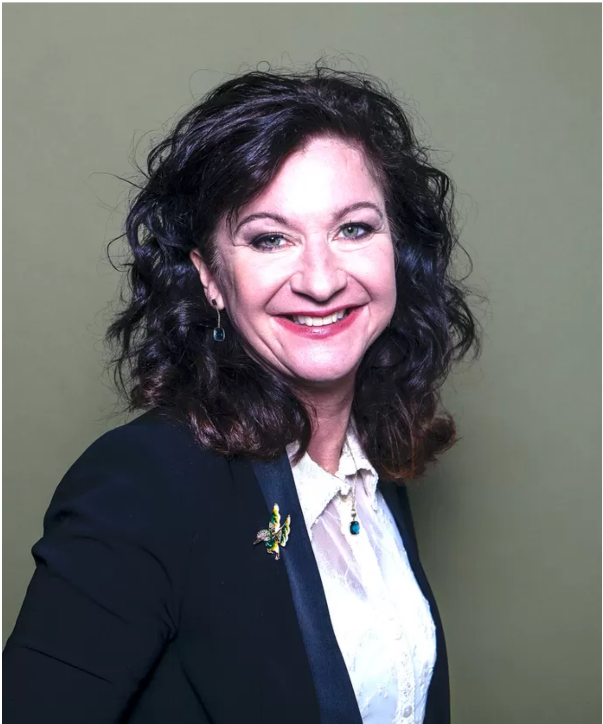
Danielle Braun © RV